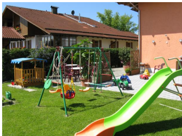
Kinderspielplatz mit Terrasse

Drum nutz' die vielen Möglichkeiten zu Deinen schönsten Lebenszeiten.“